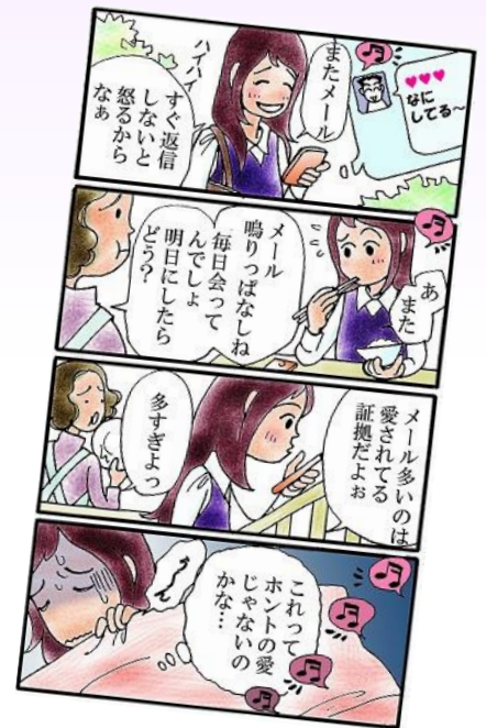
イラスト：ちだりえこ

恋愛中の若い男女の間にありがちな こんな思いの陰に『デートDV』がひそんでいます。 よくあるけど、気づきにくい身近な『デートDV』について 考えてみませんか?